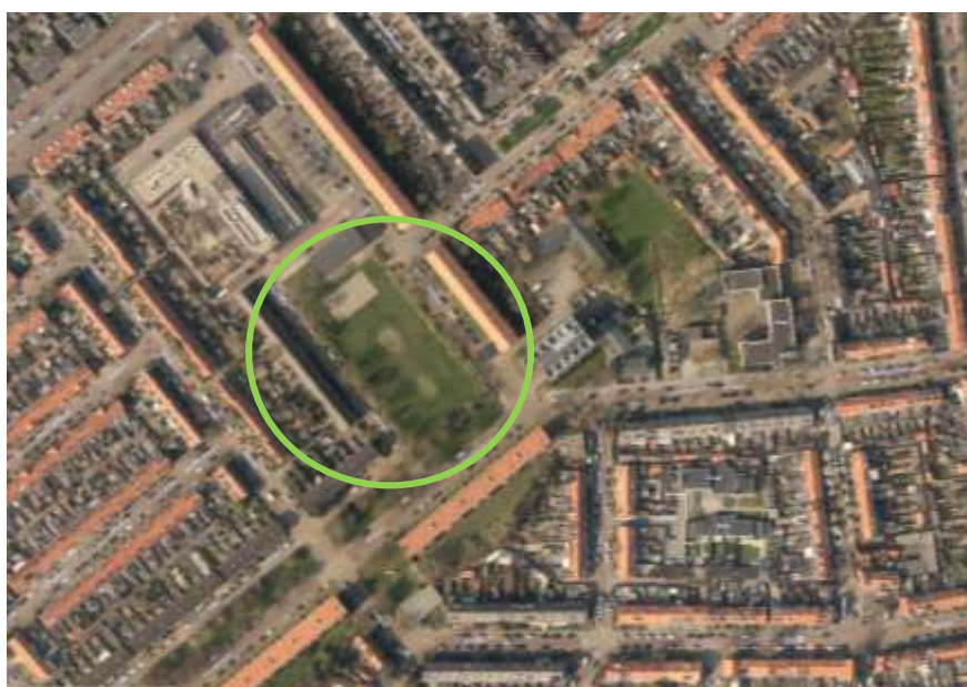
Afbeelding 1: Luchtfoto, ligging van het gymnastieklokaal en bijbehorend plantsoen

Architect: Openbare Werken van de Gemeente Den Helder