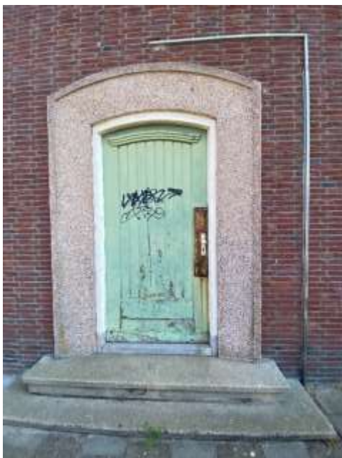
Afbeelding 5: Deur met betonnen omlijsting (2021)

Aan de noordwestgevel bevindt zich geheel links een deur, die toegankelijk is via twee stoeptreden. De licht getoogde entree bezit een forse betonnen omlijsting, die bij nadere bestudering puinresten van de oorlog bevat. Binnen de omlijsting een eveneens getoogde houten deur die is opgebouwd uit een stijlconstructie en die is ingevuld met verticale schroten. Links van het sportgedeelte zitten twee kleine vensters boven elkaar; één op de begane grond en één op de verdieping. Rechts van deze vensters is de sportruimte, die een achttal traveeën laat zien, die worden gemarkeerd door bakstenen kolommen.