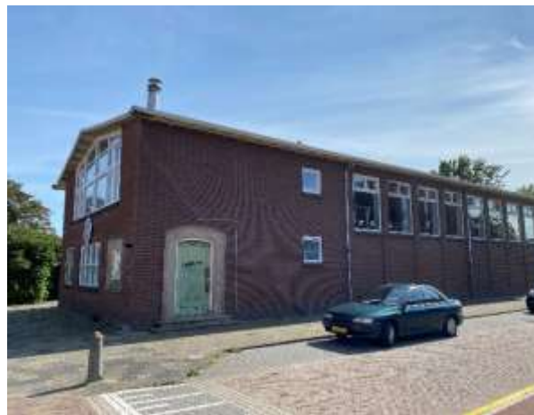
Afbeelding 4: Noordwestgevel (2021)

De noordoostgevel ligt expliciet aan de straat. Hoewel er bij deze gevel geen entree aanwezig is, wordt deze wel als voorgevel benoemd. De gevel heeft een symmetrische opbouw. Er is sprake van een driedeling op de begane grond. In het midden een samengesteld venster van vier ruiten horizontaal en twee verticaal. Aan weerszijden twee vierkante gevelopeningen met een gelijke afmeting, met dien verstande dat de rechter binnen die maatvoering een forse