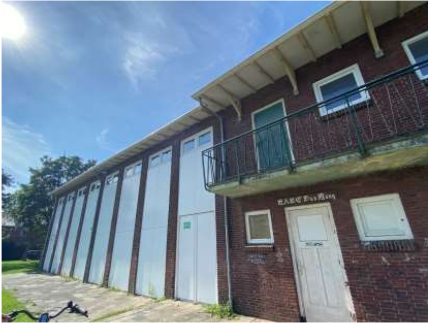
Afbeelding 7: Oostgevel met dichtgezette vensters (2021)