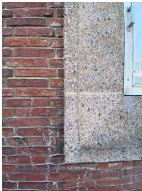
Afbeelding 6: Betonnen lijst van venster in voorgevel (2021)

Aan de oostgevel krijgt het rechter gedeelte een accent door een veel forsere overstek van het dak. De op een lang bordes uitmondende trap, is hierdoor tegen de regen beschermd. De trap is opgebouwd uit treden van beton. De ijzeren trapleuning heeft een kenmerkende jaren vijftig vormgeving, die bestaat uit V-vormig gesmede stukken ijzer. Via een eenvoudige houten deur aan het trapbordes is de achterliggende ruimte bereikbaar. Direct onder deze deur is op de begane grond een houten paneeldeur zichtbaar met venster en een klein, hoog geplaatst, vierkant venster aan weerszijden. Op de verdieping zijn rechts van de entreedeur eveneens drie vierkante vensters van circa 1 x 1 meter zichtbaar.