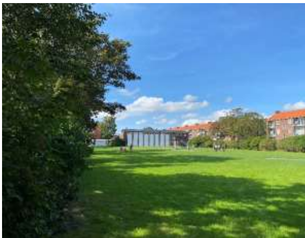
Afbeelding 3: Zuidoostgevel en het plantsoen (2021)

Gebouw met een langwerpige plattegrond en afgedekt met een flauw en overstekend zadeldak. Het gebouw ligt in de noordoost-zuidwest richting. Het gebouwtje is grotendeels van baksteen (opgetrokken in strekkenverband). Het heeft over het noordoostelijk gedeelte twee verdiepingen (daarin bevinden zich bijeenkomstruimtes) en het zuidwestelijk deel bestaat uit één verdieping; daarin bevindt zich een sportruimte. De sportruimte is iets groter dan de helft van het gebouw. Het andere gedeelte is verdeeld in een separaat toegankelijke boven- en benedenverdieping. De bovenverdieping is door middel van een trap bereikbaar, direct links van de noordgevel.