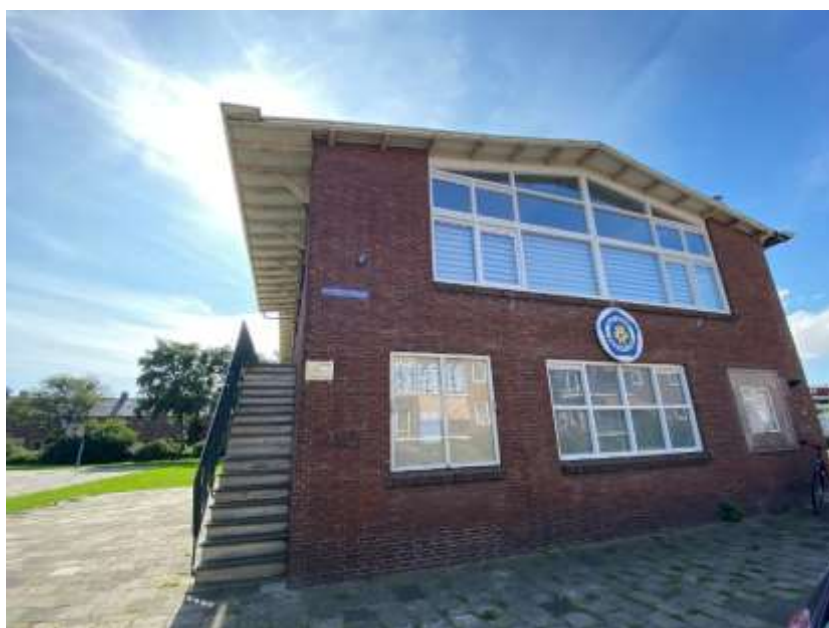
Afbeelding 2: Voorgevel (2021)