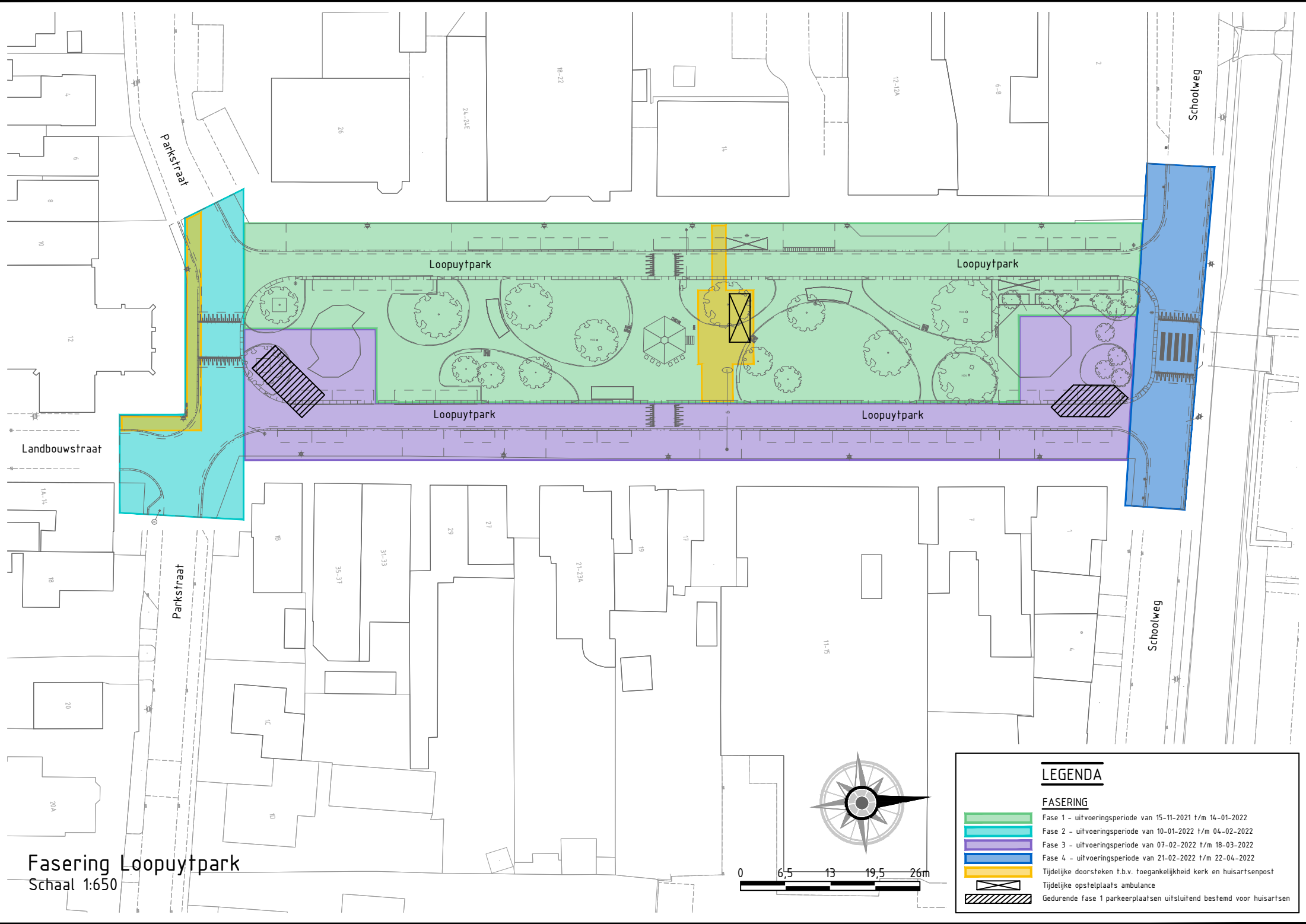
Fasering Loopuytpark Schaal 1:650