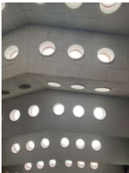
Afbeelding 8: Waaivormig dak met ronde openingen (2021)

Het interieur bezit bijna geen waardevolle onderdelen. Alleen het speelse effect van het waaivormige dak met de ronde openingen is bijzonder; dit onderdeel is architectonisch van belang.