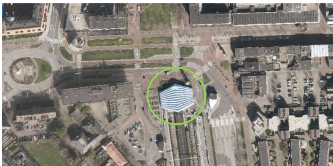
Afbeelding 1: Luchtfoto (2020), ligging van het stationsgebouw