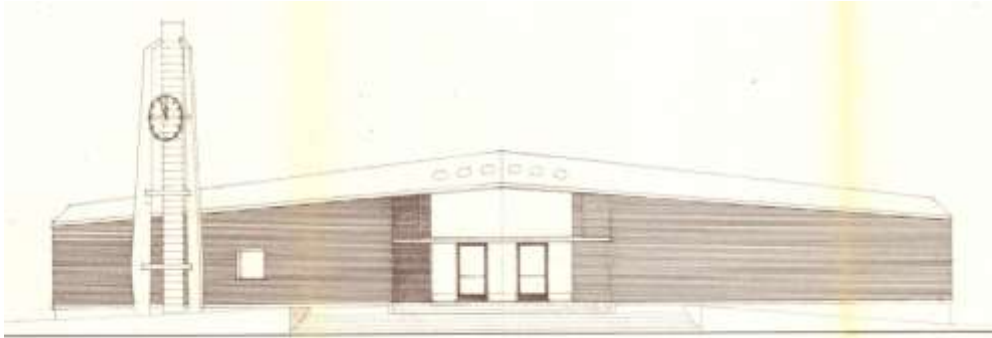
Afbeelding 5: Oorspronkelijk ontwerp stationsgebouw, voorgevel (1956)