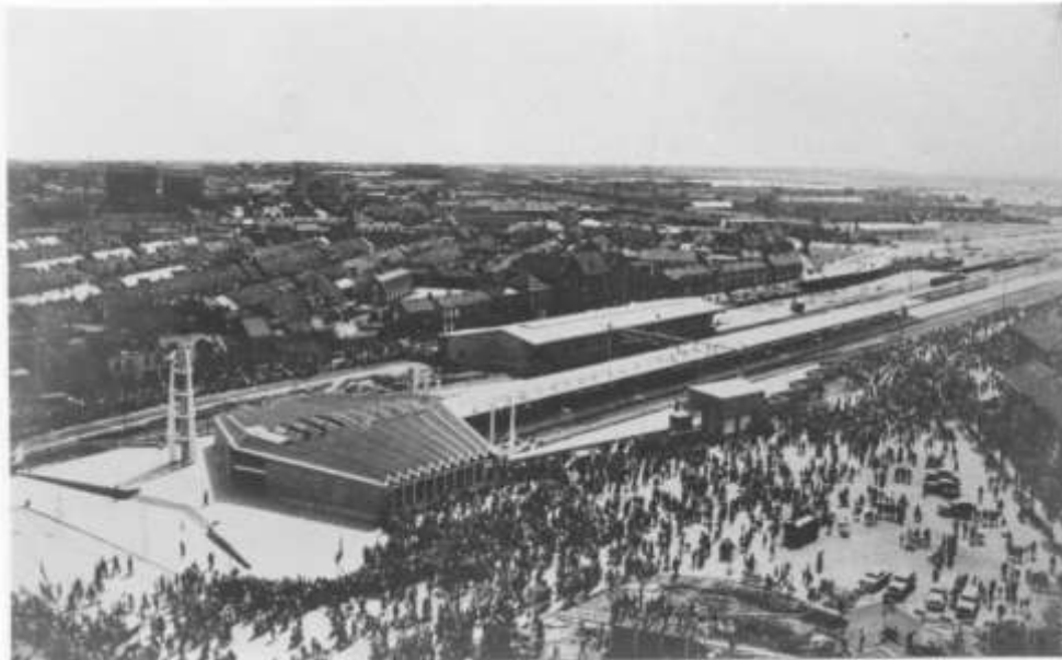
Afbeelding 3: De opening van het nieuwe station (1958).

In 1946 presenteerde stedenbouwkundige Wieger Bruin een plan voor de wederopbouw van Den Helder. In dit plan speelde het nieuwe station een belangrijke rol: het werd als centrale markering geplaatst met daaromheen een plein vol voorzieningen, zoals een schouwburg, gemeentehuis en postkantoor. Uiteindelijk is dit plan niet volledig uitgevoerd zoals Wieger Bruin had bedacht wegens geldgebrek bij het Rijk, de gemeente en de Nationale Spoorwegen.