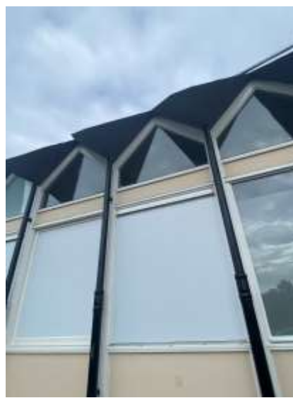
Afbeelding 9: Detail zijgevel (2021)