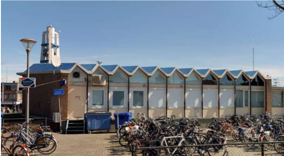
Afbeelding 7: Oostelijke zijgevel (2021)

De voorgevel (noord) vormt de entree naar de stad. Het is een tweeledige, gesloten bakstenen gevel, die in het midden op een knik samenkomt. De gevel loopt naar het midden toe qua hoogte op, zodat hij bij de knik op zijn hoogst is. In dat midden bevindt zich in een dieper terug gelegen glazen portaal, de hoofdentree van het station, aan de bovenzijde gemarkeerd door een betonnen luifel. Daarboven een dubbel, geknikt venster. Er bevindt zich een klein venster aan de linkerzijde van de entree, deze is dichtgezet.