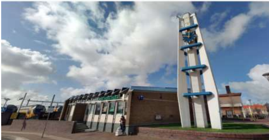
Afbeelding 6: Westelijke zijgevel en klokkentoren (2021)

De klokkentoren staat aan de noordoostzijde van het station, links voor de voorgevel. De klokkentoren is voorzien van een vierkante schoorsteen als middenspil. Daaromheen staan drie geknikte betonnen pijlers, die met de schoorsteen verbonden zijn door vier horizontale verbindingstukken. Aan twee van de drie zijden is een uurwerk bevestigd.