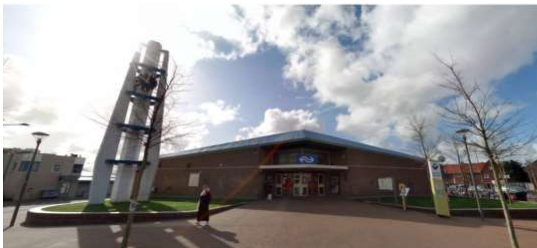
Afbeelding 2: Vooraanzicht stationsgebouw (2021)