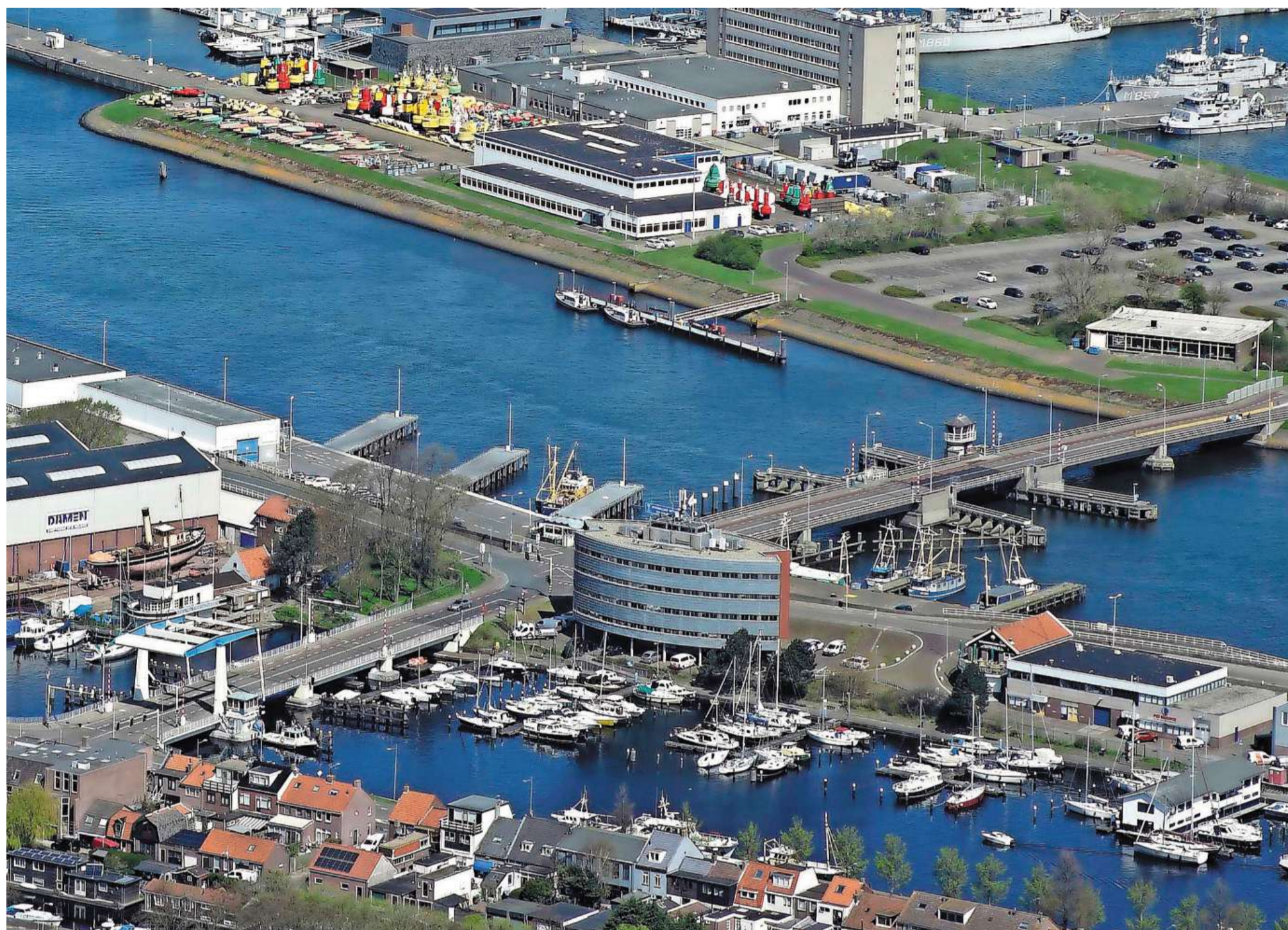
Verplaatsing van de Moormanbrug (rechts) en de Van Kinsbergenbrug (links), een serieuze optie zo blijkt uit het onderzoek van ontwerp bureaus.