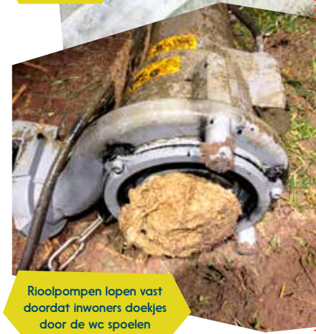
Rioolpompen lopen vast doordat inwoners doekjes door de wc spoelen

Daarom de vraag aan al onze inwoners om geen doekjes, mondkapjes, frituurvet en andere vreemde zaken door de wc te spoelen. Alle doekjes en mondkapjes horen gewoon bij het restafval. Frituurvet kunt u gescheiden inleveren bij het afvalbrengstation.