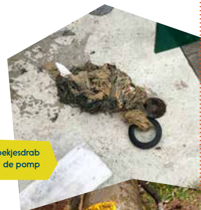
Doekjesdrab uit de pomp

Het onderhoud van ons riool kost al veel geld, maar door dit soort problemen kost het steeds meer. Geld dat u uiteindelijk zelf betaalt via de rioolstoffenheffing.