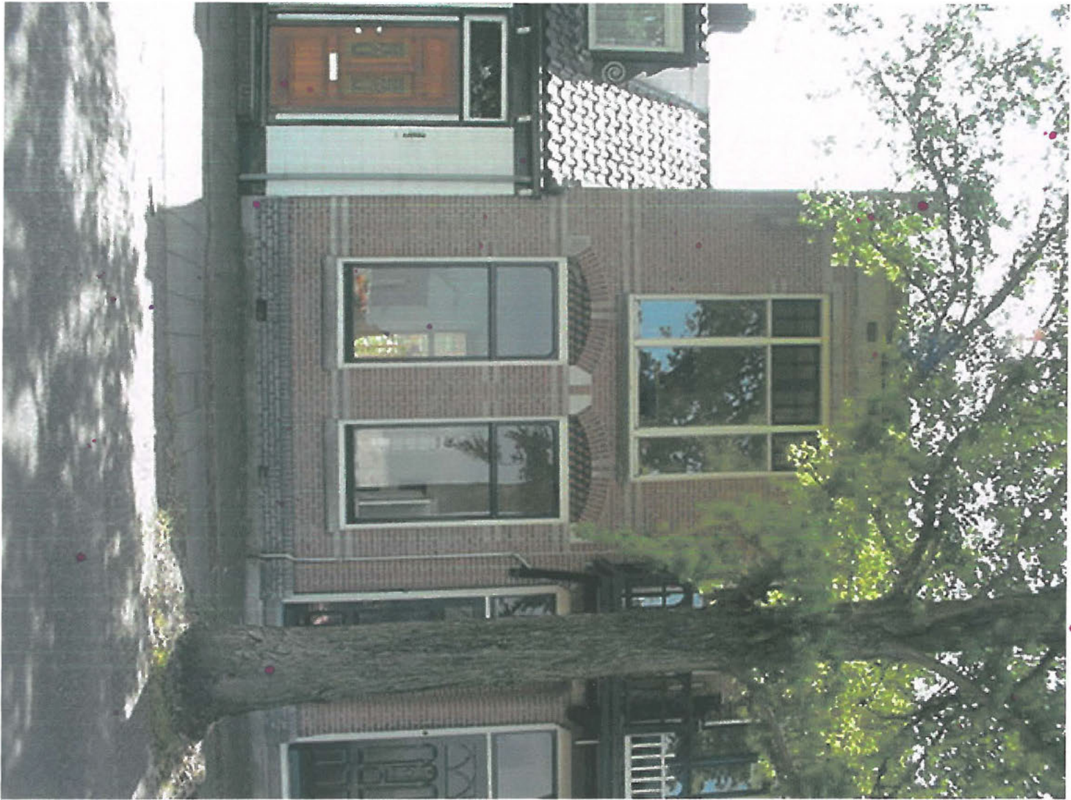
Binnenhaven 119 juni 2001